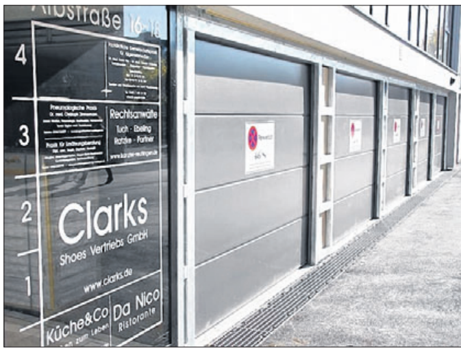
Der rückseitige Eingang Albstraße 16-18 ist vom Parkplatz zugänglich.

Nun ist zunächst das Projekt an der Albstraße mit den Hausnummern 16 bis 18 vollendet worden. Ende September sind bereits die beiden All-