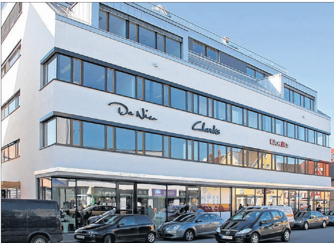
Der jüngste Komplex der Oberen Wässere, gesehen von der Albstraße und vom Achalmbad her.

ser in der Straße aufgegriffen, nach hinten zur Markthalle hin ist ein Flachdach erkennbar. Was zum einen zu zwei Dachgeschossen geführt hat, gleichzeitig beim Blick von der Seite auf das Gebäude aber auch eine ungewöhnliche Ansicht offenbart.