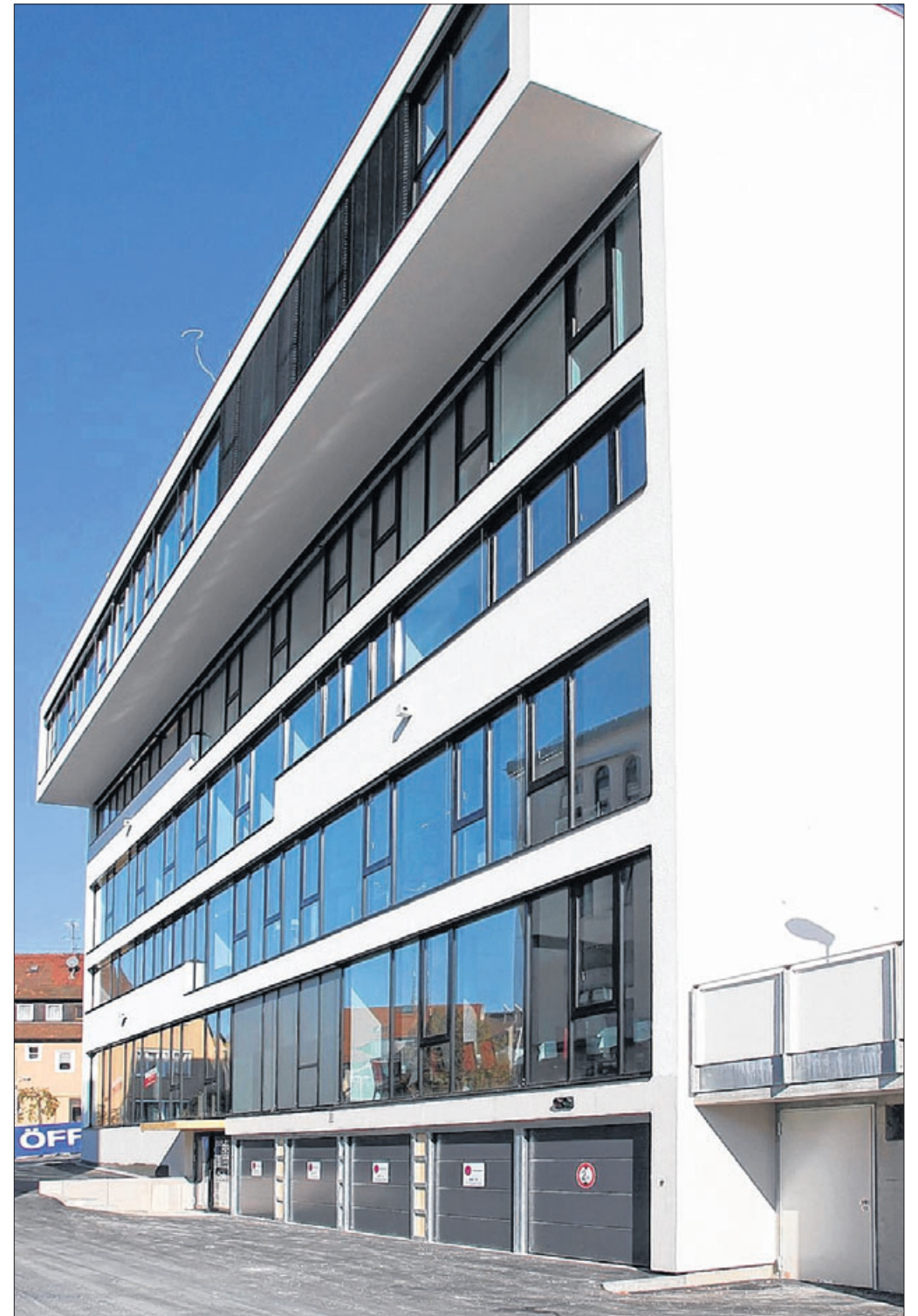
Die voll verglaste Sonnenseite der Albstraße 16-18 öffnet sich zur Markthalle hin.